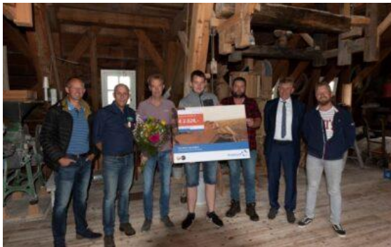
De prijsuitreiking op de meelzolder

Van het Iepen Mienskipsfûns van de provincie Fryslân is subsidie gekregen. Hiermee is het grootste deel van het geld binnen. Komende tijd worden andere fondsen aangeschreven.